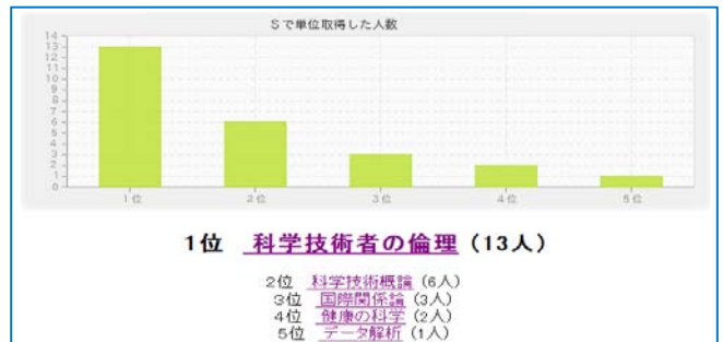
図3：ランキング機能

講義評価で投稿されたデータを別の形で見せたいと考え、データを集計してランキング形式で閲覧できるようにしたい。