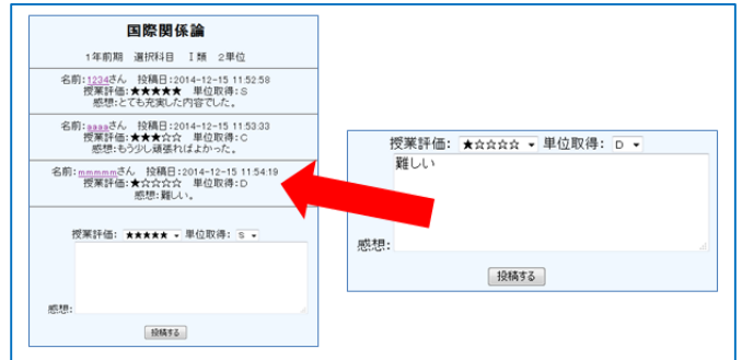
図2：講義評価システム

当サイトのメイン機能である。各講義ごとに設置されており、図2のように「講義評価」「単位取得」を選択し「感想」を入力することで投稿が可能である。