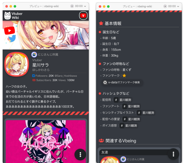
図 2 Vtuber 個別ページのスマホ用 UI

Vtuber 個別ページの UI を図 2 に示す。Vtuber のデータ属性にはテーマカラーが保持され、個別ページのアクセントカラーに反映される。図 2 はテーマカラーが赤色の例である。